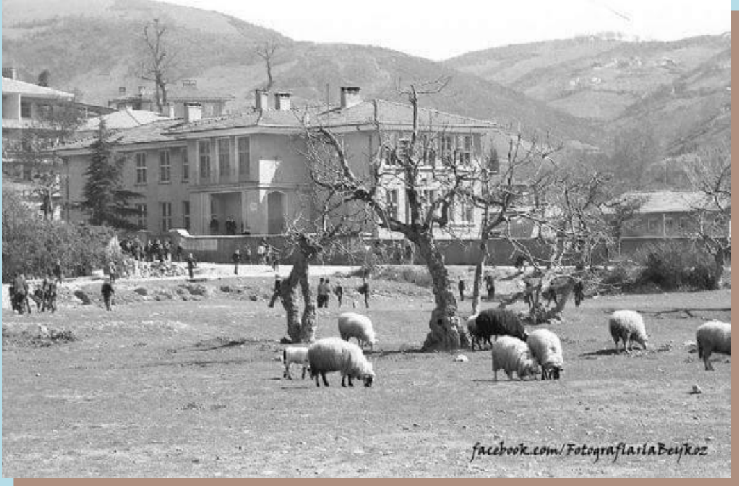
(1960'lı yıllara ait bir resim)