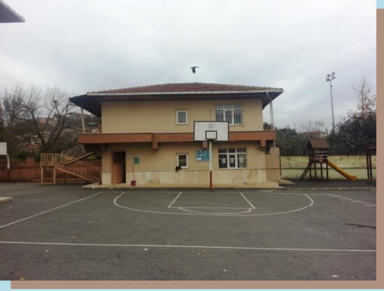
( Anasınıfı ve Öğretmenler Odası Yan Görünüm)

Orta kısımda bulunan iki katlı binamız ise ilk zamanlar için lojman olarak kullanılmış sonrasında anasınıfı ve öğretmenler odası olarak kullanıma geçmiştir.