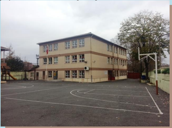
( B Blok Yan Görünüm)

Geçen zaman içinde 1982 yılına gelindiğinde ise şu an B Blok olarak adlandırılan ikinci bina yapılarak hizmete açılmıştır.