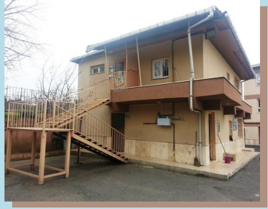
( Anasınıfı Giriş)

Okulumuz 2012 Yılında okul dönüşümleri kapsamında ilkokula dönüştürülmüş ve hali hazırda FATİHOCA İLKOKULU olarak ikili (sabahçı – öğlenci) öğretim yapmaktadır.