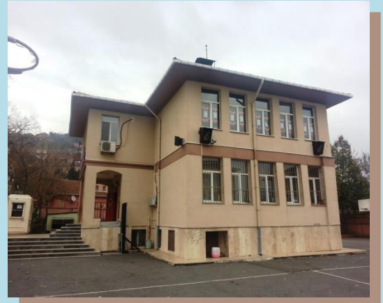
( A Blok Yan Görünüm)

İlerleyen yıllarda binanın yetersiz kalması nedeniyle, okulun arka bahçesine konteynır derslikler eklenmiştir.