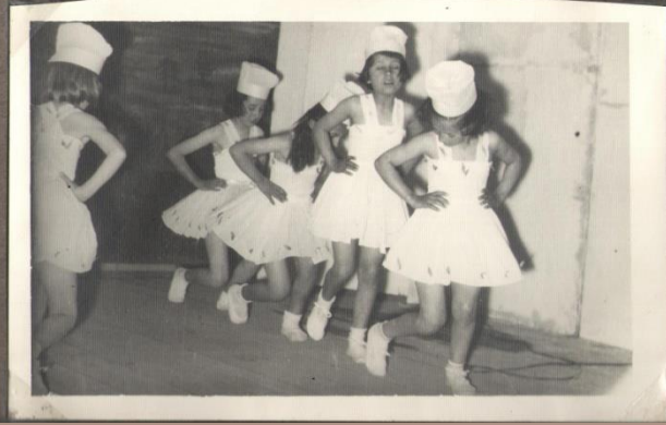
(Fatihoca İlkokulu İik Bayram Müsameresi 1956)

Müsamerede Ekmekçiler ronu oynayan küçükler 23/Nisan/1956