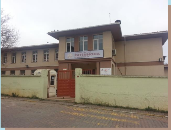
( A Blok Giriş Kapısı)