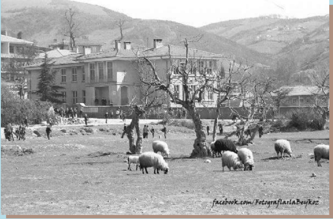
(1960'lı yıllara ait bir resim)