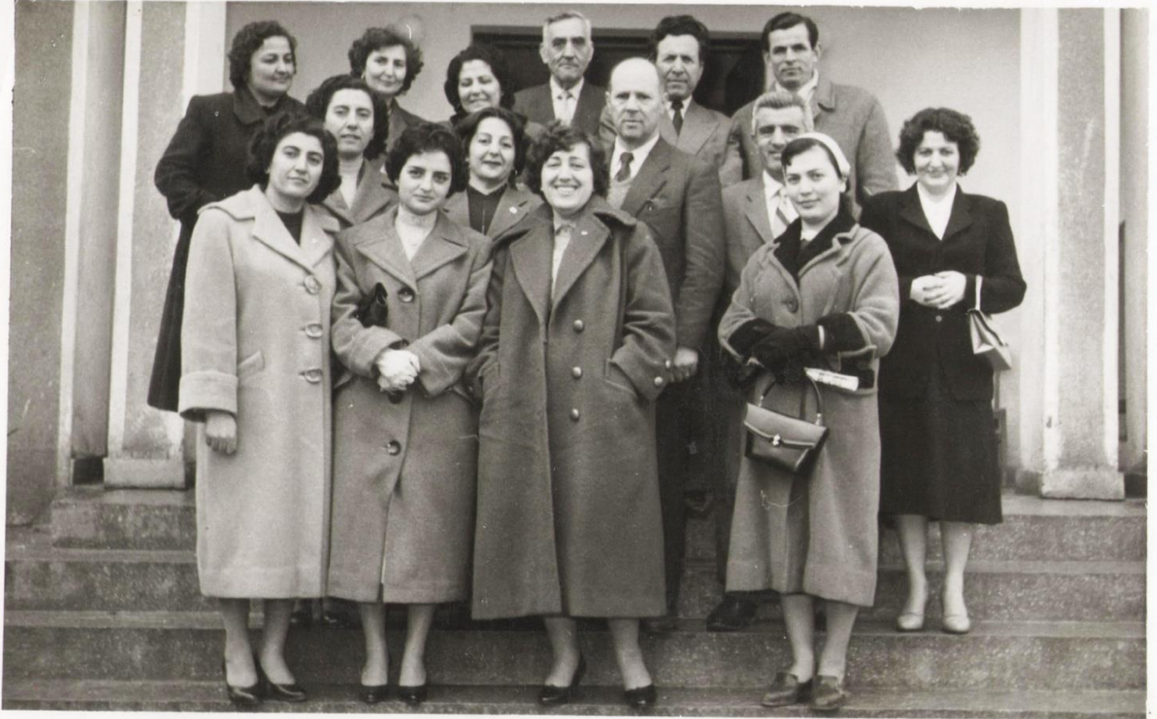
(Fatihoca İlkokulu İlk Öğretmen Kadrosu 1956 – 1957)