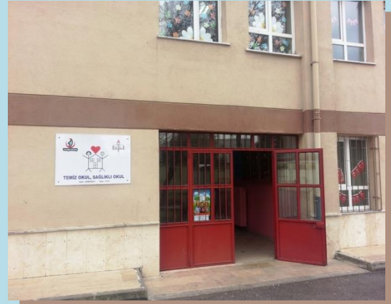
( B Blok Giriş)